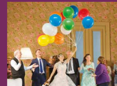
A NOIVA DO CZAR Ópera Estatal de Berlim