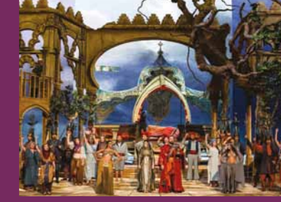
O RAPTO NO HARÉM Ópera de Paris