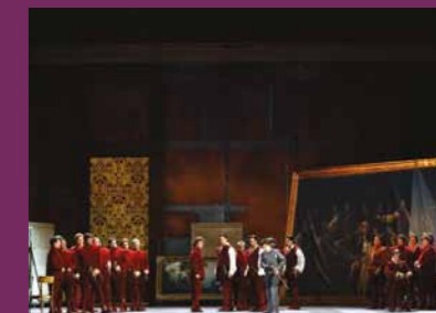
OS CAPULETO E OS MONTÉQUIO Teatro La Fenice de Veneza