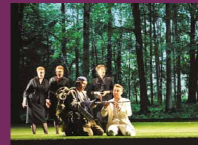
A FLAUTA MÁGICA Festival de Baden Baden