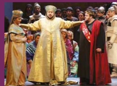
AÍDA Teatro Alla Scala de Milão